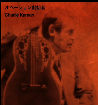
オペーション創始者 Charlie Kaman

すべては1976年のアダマス誕生とともに始まった。 オペーションの創始者チャーリー・カマンは 音響特性に優れた新しいボディ形状 「ラウンドバック」を発案後も、 ギターサウンドへのさらなる探究心から、 当時自社の航空宇宙分野で使用していた薄く振動特性に優れた カーボングラファイトのギタートップへの採用に着目した。 そして遂にアダマスサウンドの核となる 「ファイブロニクスサウンドボード」を完成させたのである。 それは、2枚の薄いカーボングラファイトの間に 薄いバーチを挟んだ新構造の材で、 ウッドトップの約1/3の薄さでありながら ＜レスポンスが速い・共鳴が大きい・振動が長い＞という 3大利点を高次元で満たしたまさに画期的なトップであった。 また同時期に、アダマスのサウンドを最大限に引き出すために、 いまやオペーションを象徴する意匠として有名な マルチホールの「エポーレット」をも生み出し、 その鮮烈な個性で世界を驚愕させた。 そして2005年。アダマス誕生30周年を記念して、 我々にとっても夢のような ＜最新及び復刻＞限定4モデルを、今ここに。