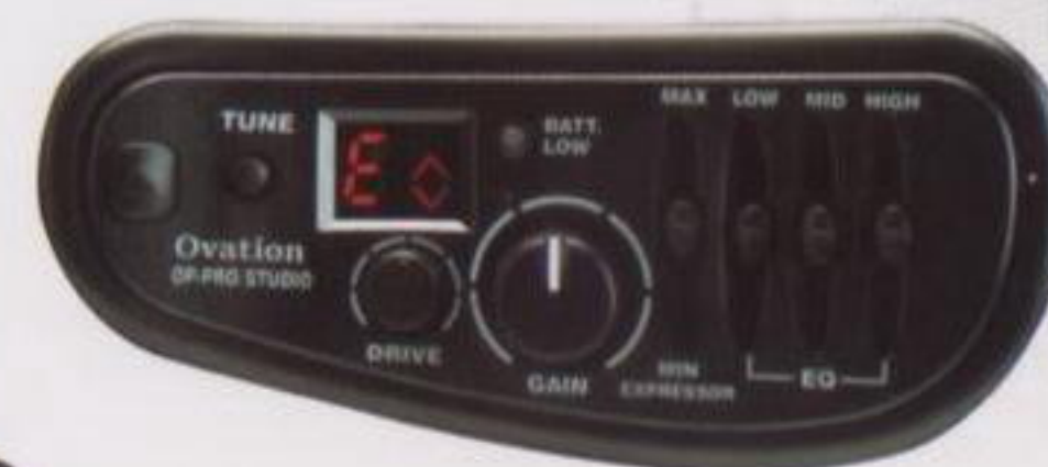
OP Pro Studio