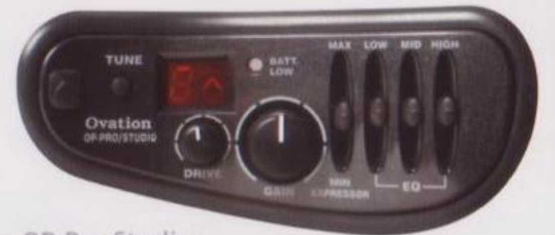
OP Pro Studio

オベーションの長い歴史の中で、数多くのトップ・ギタリストとの間で培ってきたオベーション・サウンドを、もっと身近に体験できるように誕生させたシリーズがプロ・シリーズです。しかし、そこに妥協はありません。伝統のコンポジット・コンストラクション・テクノロジー、ハイクオリティなエレクトロニクス・デザイン、優れたバランスとクリアなサウンド、オベーション・サウンドと形容される全てがプロ・シリーズにはあります。