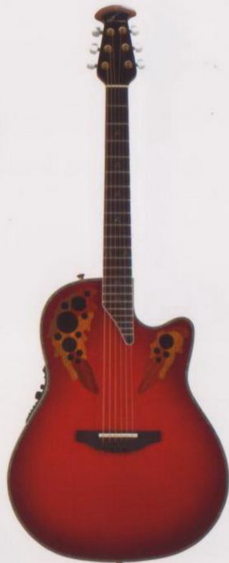
Custom Elite C2078AX-RTD