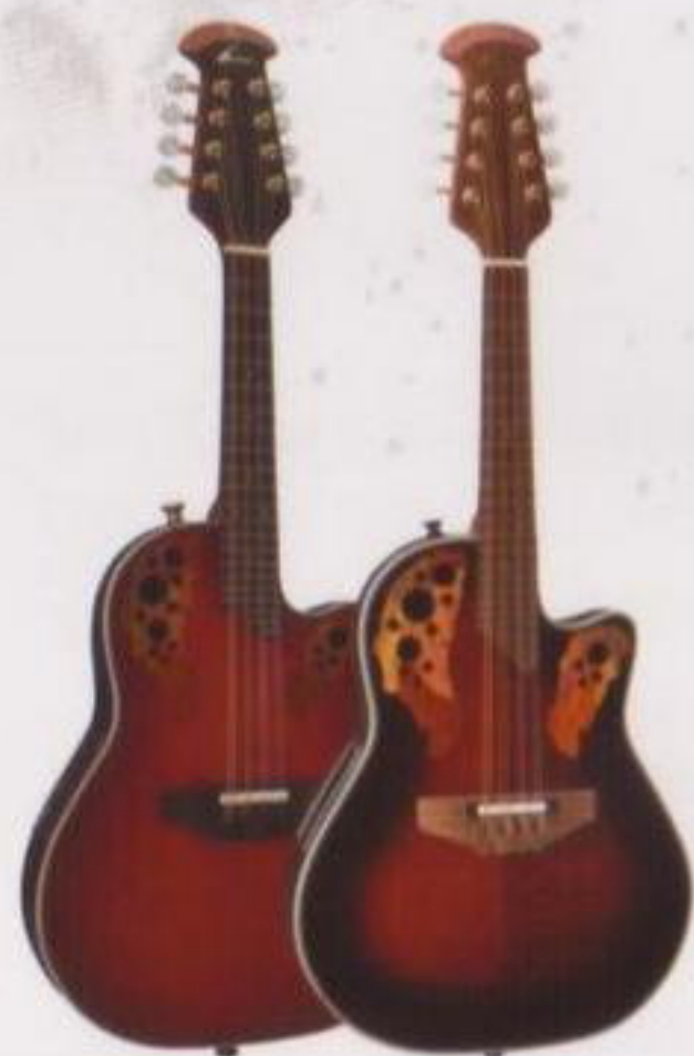
Mandolin MM68AX-CCB & MCS148-RRB