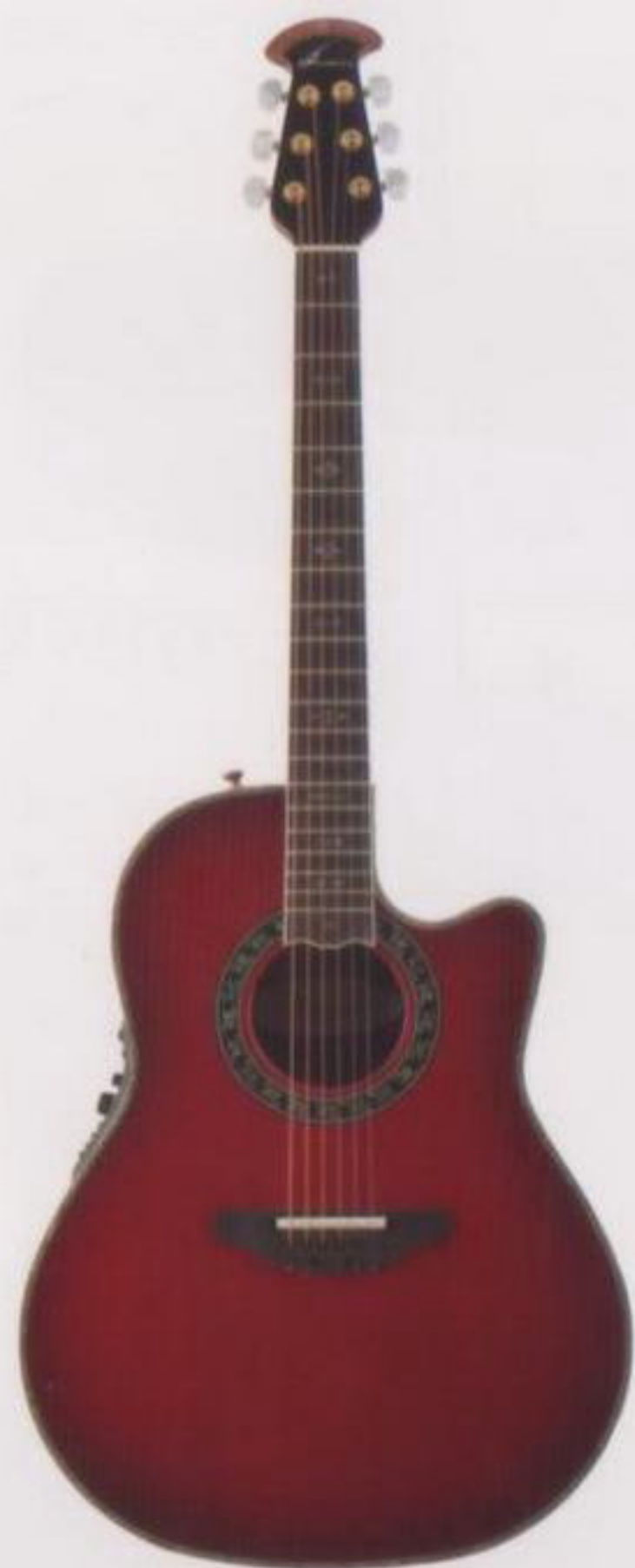
Custom Legend C2079AX-CCB